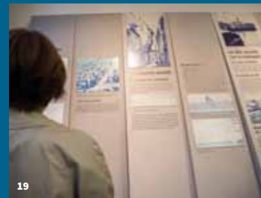
19. Exposition permanente