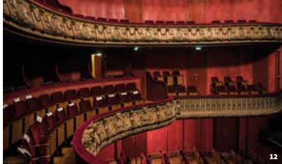
12. Théâtre Piccolo