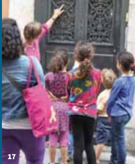
18. De porte en porte